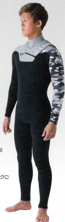
SHELL TIP ZIP CONBI フルスーツ3.5ALL ¥59,000 プリントJ-OP ¥6,000 Color:クロ×SKグレー×カモクロ カラー Ⓑ