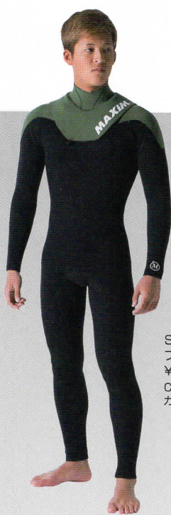
SHELL N17W CONBI フルスーツ3.5ALL ¥56,000 Color:クロ×カーキ×カーキ カラー Ⓐ