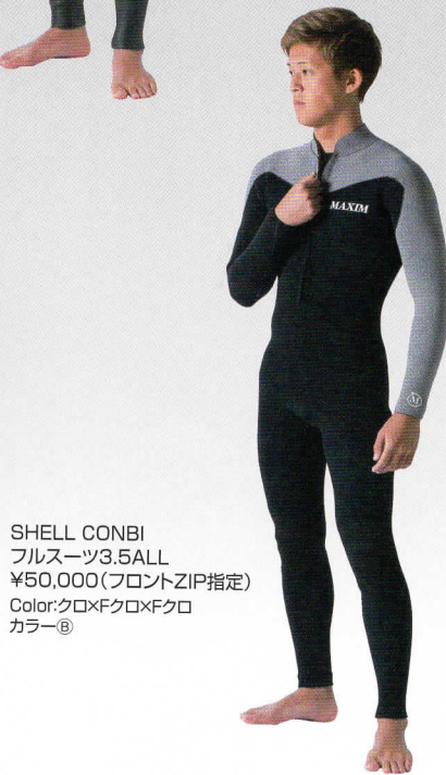
SHELL CONBI フルスーツ3.5ALL ¥50,000(フロントZIP指定) Color:クロ×Fクロ×Fクロ カラー Ⓑ