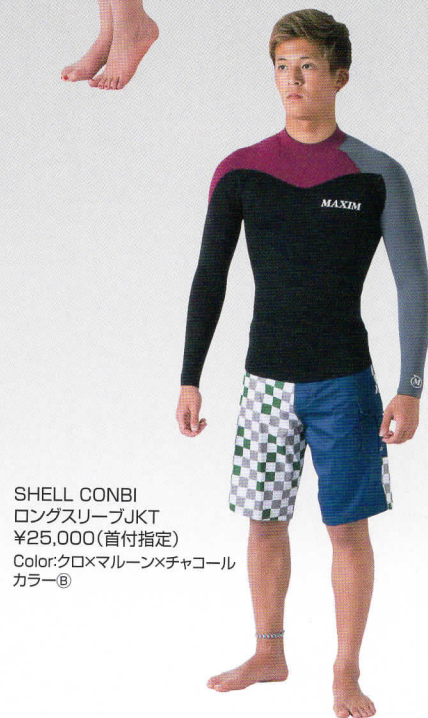
SHELL CONBI ロングスリーブJKT ¥25,000(首付指定) Color:クロ×マルーン×チャコール カラー Ⓑ