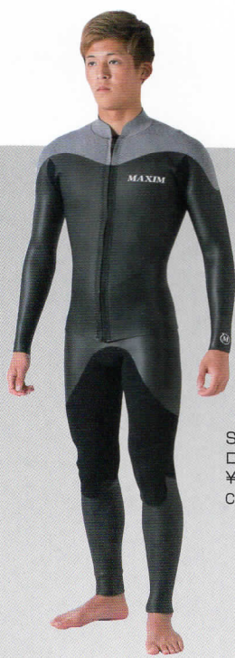
SHELL CONBI ロングスリーブJKT ¥25,000 (襟付・フロントZIP指定) Color:スキン×Fクロ×Fクロ カラー Ⓐ