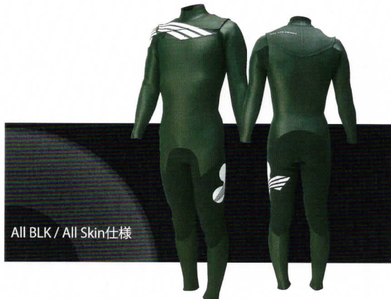
All BLK / All Skin仕様

Color ベース: BLK固定 右肩・フラップ・左手首: SLATE 左肩: WHT Mark 右肩: B1 / BLK 左腿: B2 / WHT