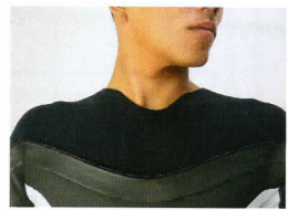
● 開口部をウェーブカット、着脱生UP!