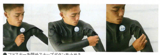
● ファスナーを閉めスナップボタンを止める。