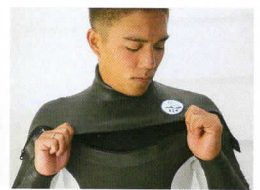
● ストレッチファスナー