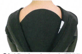
● Back Zip : ウォーターセーバー標準装備 防水構造のファスナーシステムです。

プロロングボダー『榎本 信介』プロデュースのE'Sモデル。クラシックな風合い、雰囲気コンセプトにしたバックジップシステムのウェットスーツです。袖のワッペンがポイントです!